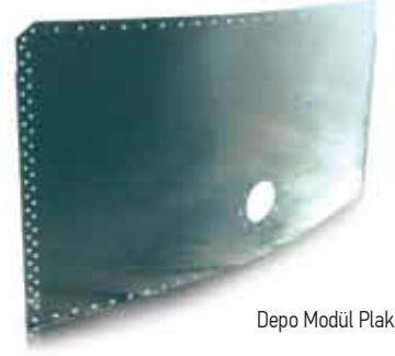
Depo Modül Plakası

Parçalar halinde fabrika şartlarında en modern imalat teknikleri kullanılarak imal edilen, çok ufak nakliye depolama hacimleri ile kullanım alanlarına sevk edilebilen, montaj halinde parçaların birbirine civatalı konstrüksiyonla bağlanarak büyük depo hacimlerinin oluşturulduğu temiz, hijyenik ve çok uzun ömürlü özel bir depo şeklindedir.