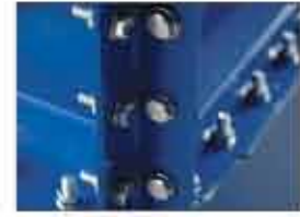
Çok güçlü ve sağlam KONSTRÜKSİYON